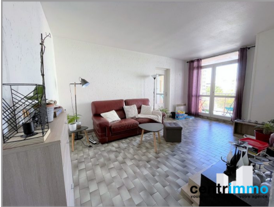
Séjour de l'appartement F2 en location à Montpellier Ouest Centrimmo