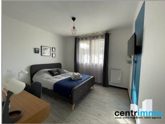
séjour 2 en colocation appartement Montpellier sud centrimmo